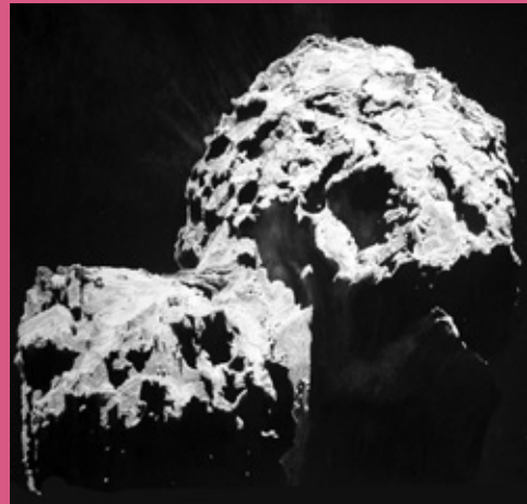
Comète - Aquarelle sur papier © Guillaume Querré