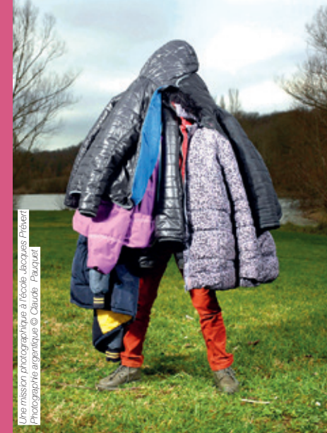
Une mission photographique à l'école Jacques Prévert Photographie argentique