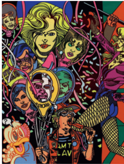
Balloons, 2008 - Sérigraphie sur Rivoli Édition Jean Villeveille © Galerie Louis Carré - Paris