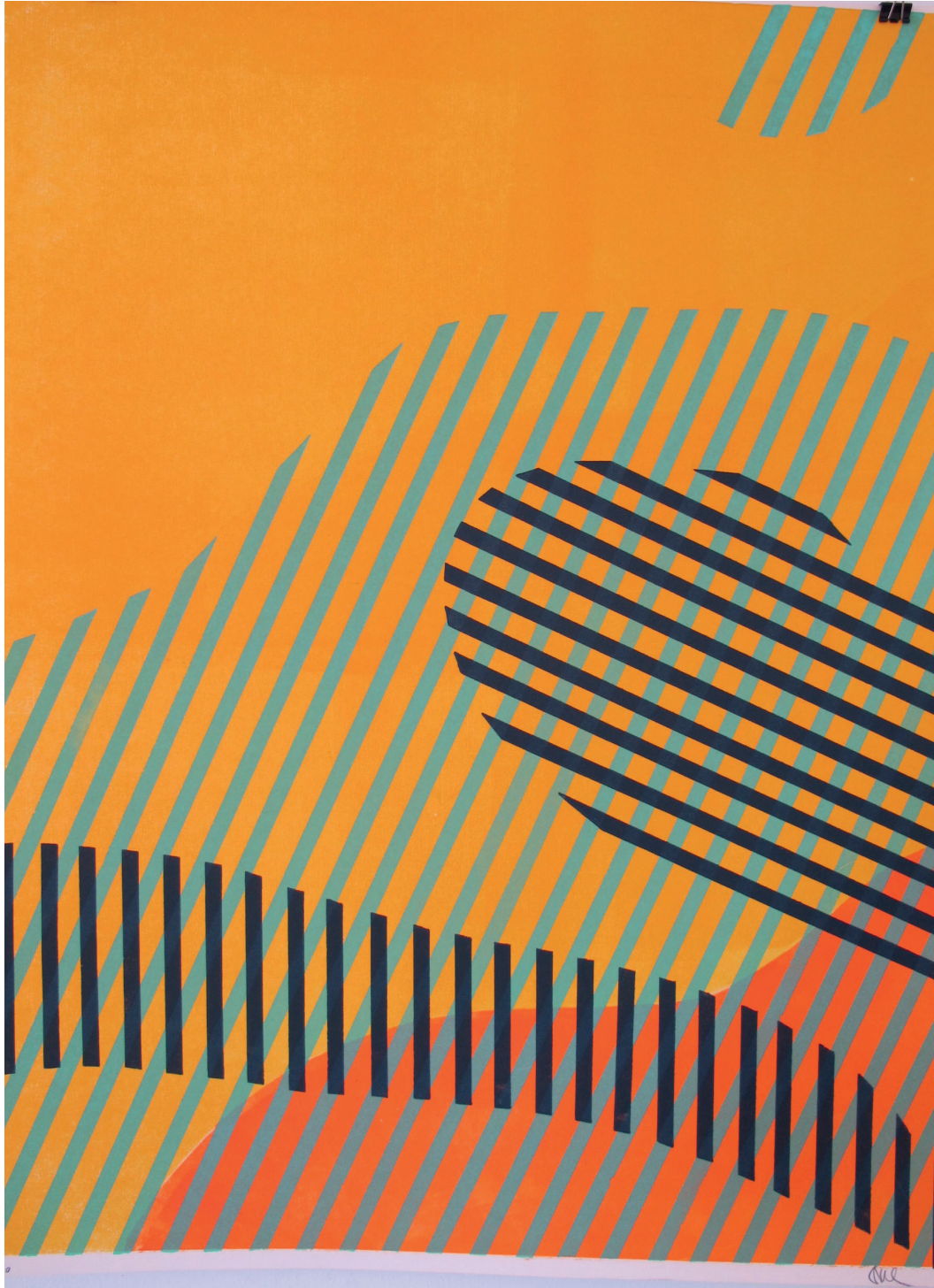
Guillaume GOUTAL, sans titre, 2002, gravure sur bois, Artothèque de Grand Châtelleraut